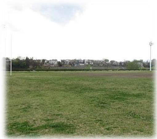
前橋RSの練習場所である敷島河川敷グラウンド

そうですね。今でもまとまったオフがあれば顔を出しに拠点である敷島河川敷に行きますね。何も無いボロボロのグラウンドなのですが、そこに行くのとラグビーを純粹に楽しんでいたあのころの気持ち思い出ることが出来ますし、スクールのコーチはいつも温かく迎えてくれます。前橋ラグビースクールの皆の事は